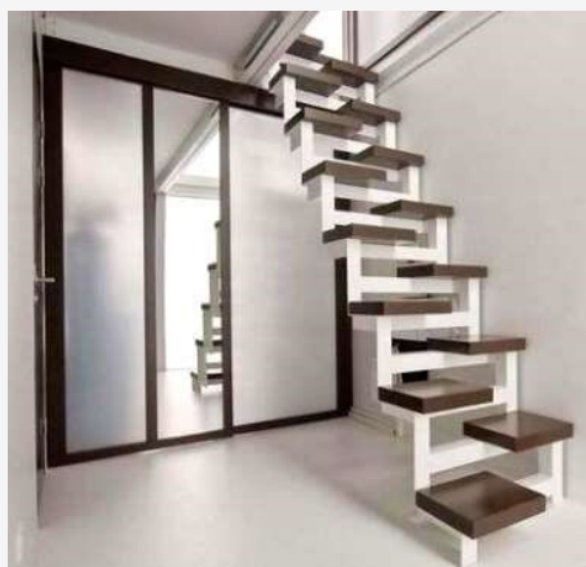
Лестница «гусиный шаг»

Лестницу «гусиный шаг» отличает асимметричная форма ступеней. Такая конструкция позволяет увеличить угол подъема и остается достаточно удобной для молодых активных людей. Если вам тяжело подниматься вверх, и вы вынуждены ходить «приставным шагом» из-за травмы или возраста, такая лестница на мансарду в маленьком доме вряд ли будет удобной в использовании.