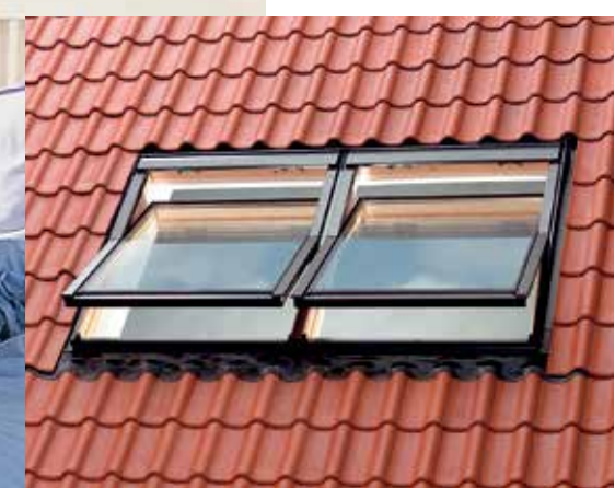
< На снимке: Два деревянных мансардных окна «Панорама» GPL размера М06 (78x118 см), затемняющая штора DKL, откосы LSC. Цена 1 окна с окладом – 29 700 руб.