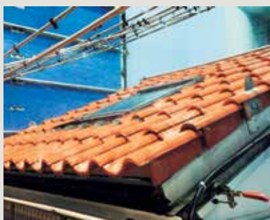
Испытание окна VELUX в аэродинамической трубе, где воссоздаются условия ливня и урагана.