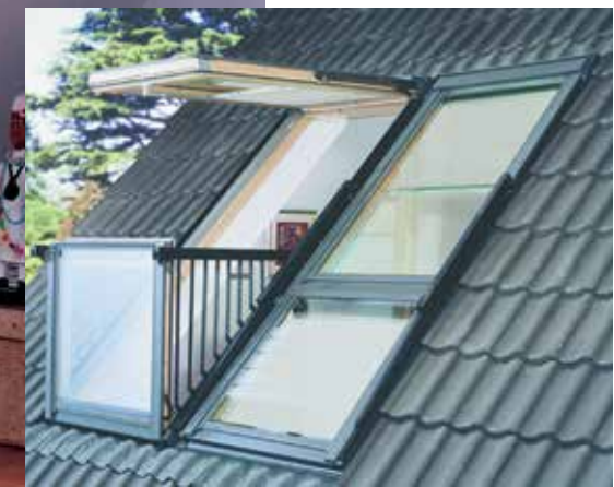
< На снимке: Два окна-балкона GDL Cabrio, установленные в комбинации. Цена 1 балкона с окладом – 145 200 руб. Рулонные шторы RFL на всех окнах, откосы для отделки.